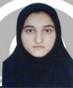
مربی: برزگری پژوهشگر برتر

با عرض سلام و آرزوی سربلندی خدمت یکایک شما دانشجو معلمان گرامی، از آنجا که هدف این دانشگاه، تربیت دانشجو معلم پژوهشگر و هم طراز نظام، با انجام پژوهش های اثربخش می‌باشد از این رو معلم دائما باید در حال تحقیق و پژوهش باشد و از ابزار های جدید در آموزش مانند: اقدام پژوهی، روایت پژوهی، درس پژوهی، مشاهده تأملی و... بهره گیرد نه اینکه صرفا بر رویکرد یادگیری شناختی متکی باشد. در چاپ سومین شماره از این گاهنامه بر آنیم تا با ارائه مباحث علمی و انعکاس فعالیت های دانشجومعلمان پژوهشگر پردیس، سطح آگاهی علمی و پژوهشی شما عزیزان را ارتقا بخشیم. در ادامه برخورد لازم می‌دانم تا از اعضاء تلاشگر هیئت تحریریه گاهنامه که ما را در تهیه این شماره از نشریه یاری نمودند قدردانی نمایم.از دانشجومعلمان گرامی دعوت به عمل می‌آید تا ما را در چاپ شماره بعدی گاه نامه مساعدت فرمایند.